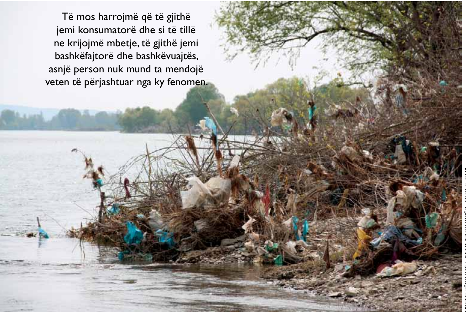
MBETJE PËRGIJATË LUMIT BUNAVSHKODËR

Të mos harrojmë që të gjithë jemi konsumatorë dhe si të tillë ne krijojmë mbetje, të gjithë jemi bashkëfajtorë dhe bashkëvuajtës, asnjë person nuk mund ta mendojë veten të përjashtuar nga ky fenomen.