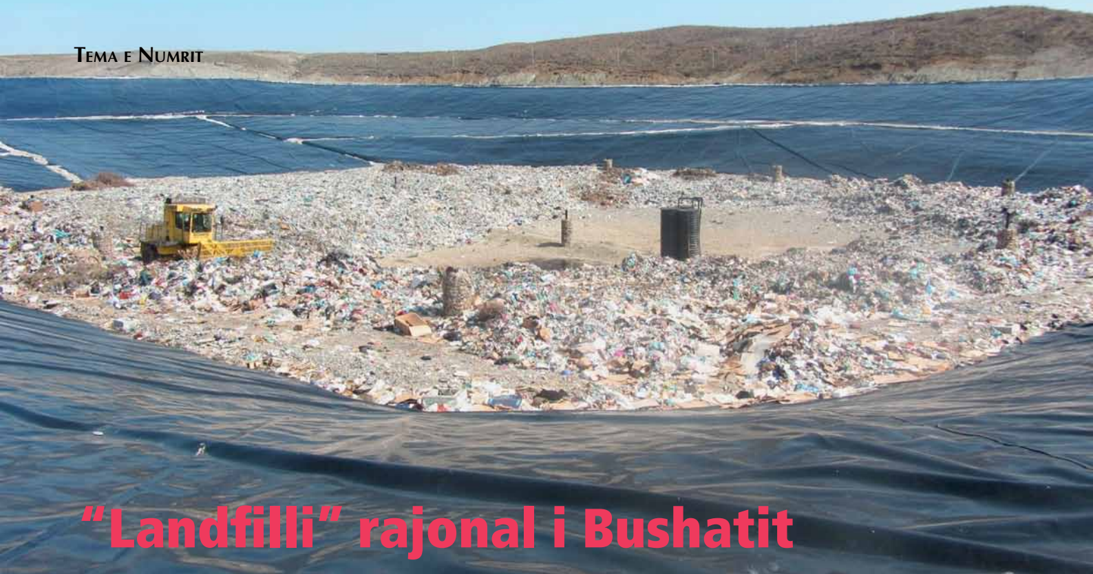
FUSHA E MBETJEVE BUSHAT