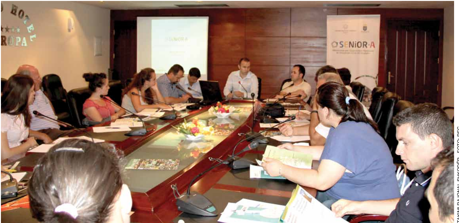
TAKIMI RAJONAL SHKODËR

SENiOR-A Mbështetje për Organizatat Mjedisore të Shoqërisë Civile në Shqipëri